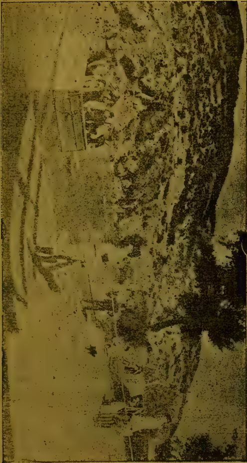
درسمات اخنلال عسکرینه قارشى روم ایلیده قیام : حریت اردوسی قطقاتندن برینک صالارله نهردن سروری